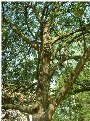
, 17 April 2003