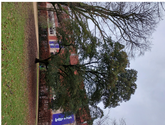
, 24 December 2024