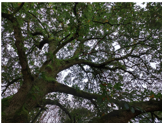
, 24 December 2024