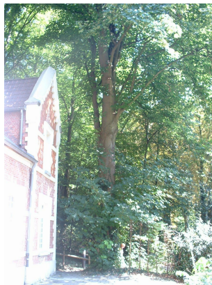
, 30 August 2005