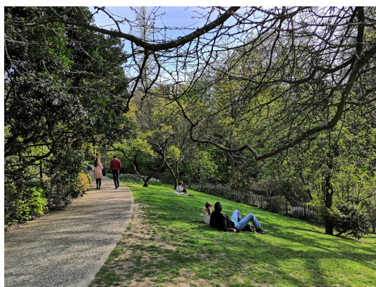
Tenboschpark, April 2021