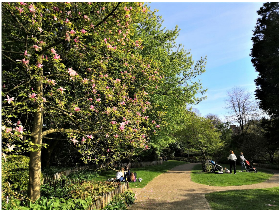
Tenboschpark, April 2021