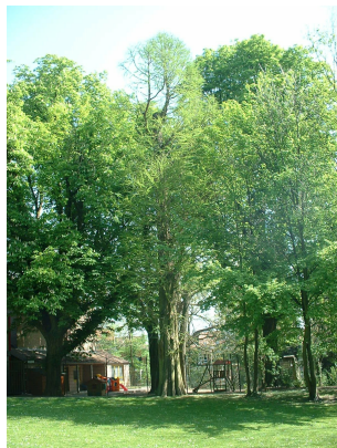
, 17 April 2003