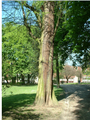
, 17 April 2003

* Deze criteria worden gewogen op de wijze als omschreven in de methodologie .