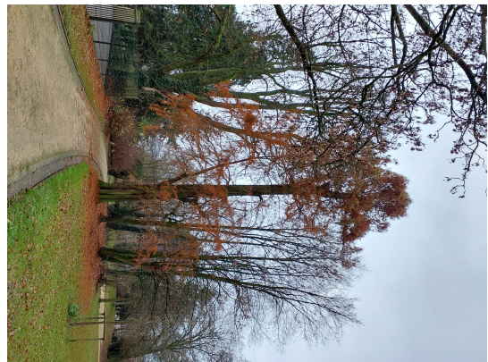
, 17 December 2024