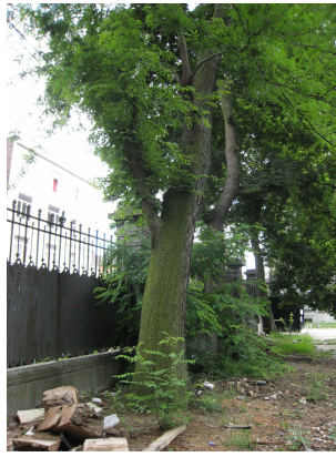
, 11 Juni 2008