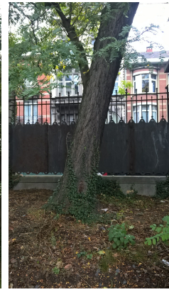
, 08 Oktober 2015