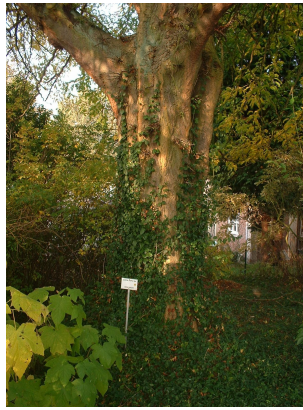
, 22 Oktober 2003