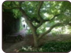
Magnolia sp Berchem-Sainte- Agathe Avenue René Comhaire, 59