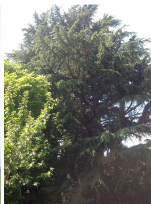
Cèdre de l'Himalaya,