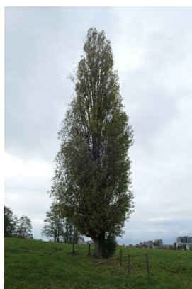
Peuplier d'Italie, Zavelenberg