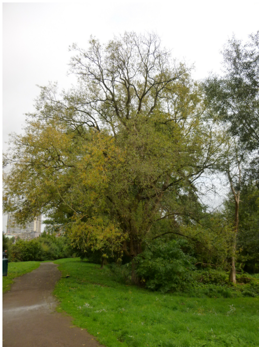
Saule cassant, Zavelenberg