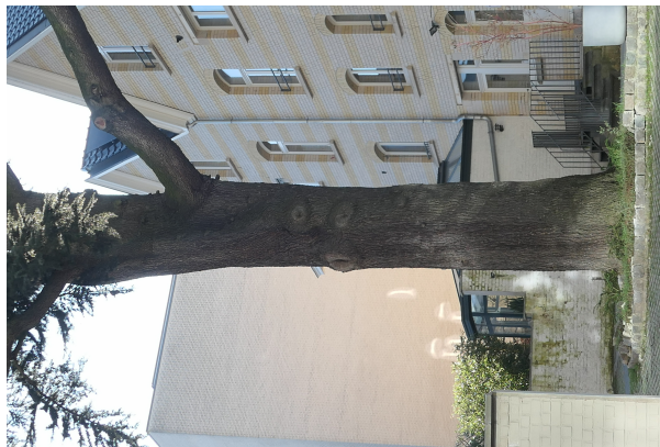
Cèdre du Liban,