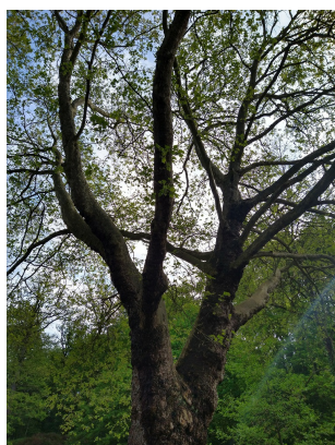
, 11 Mei 2023