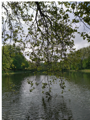
, 11 Mei 2023