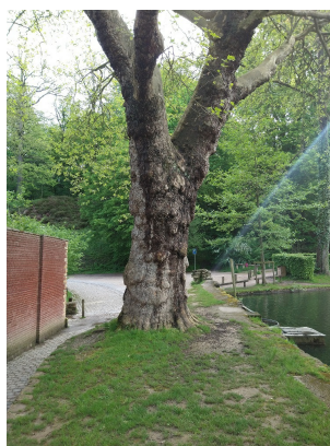
, 11 Mei 2023