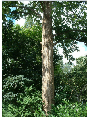
, 22 juillet 2002

XLSX (Excel 2007) - XLS (Excel 1997-2003) .