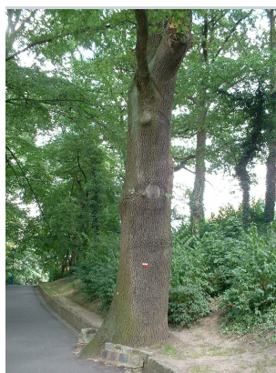
, 19 Juillet 2002

* Ces critères sont pondérés de la manière définie dans la méthodologie .