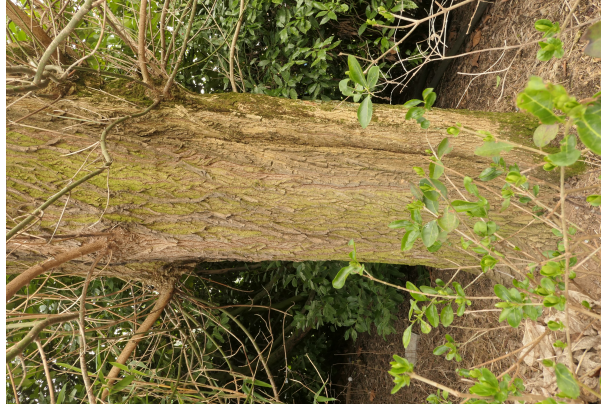
, 25 Juillet 2013