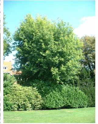
, 08 Septembre 2003