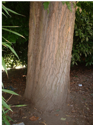
, 08 Septembre 2003