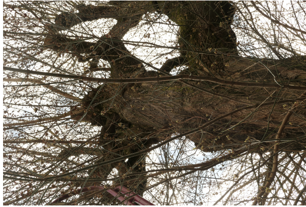
, 25 Juillet 2013