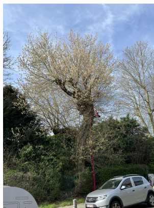
, 17 Mars 2026