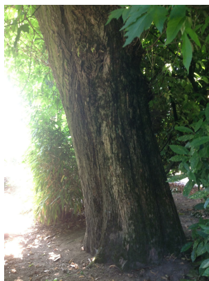
, 25 Juillet 2013