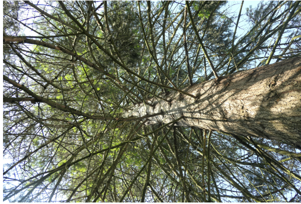
, 06 Juin 2023