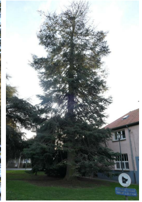
, 19 Décembre 2019