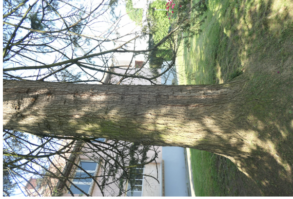
, 06 Juin 2023