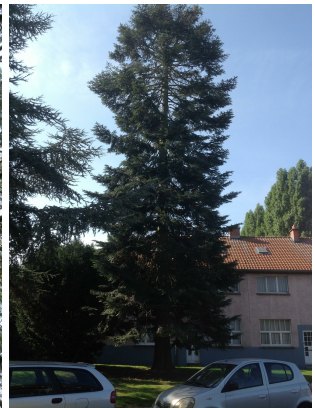
, 28 Août 2013