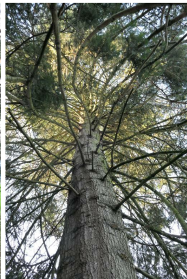
, 19 Décembre 2019