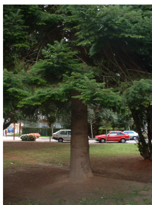
, 11 Septembre 2003