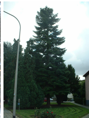
, 11 Septembre 2003