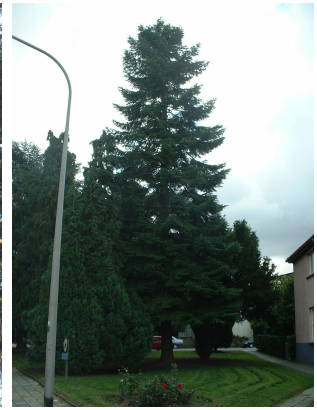
, 11 September 2003