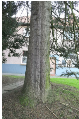
, 19 December 2019