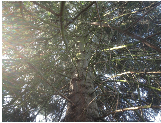
, 28 August 2013