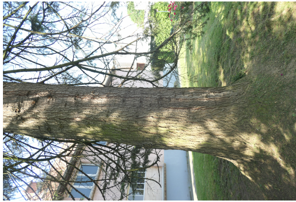
, 06 Juni 2023