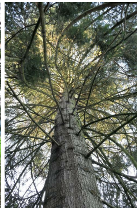
, 19 December 2019