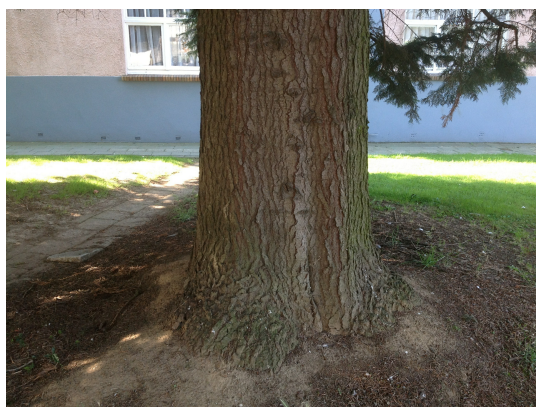
, 28 August 2013