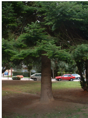
, 11 September 2003