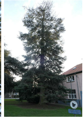
, 19 December 2019