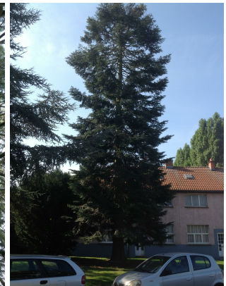
, 28 August 2013