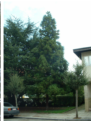
, 11 Septembre 2003