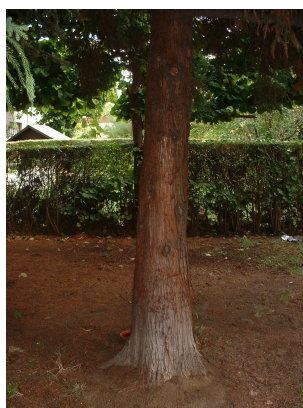
, 11 Septembre 2003