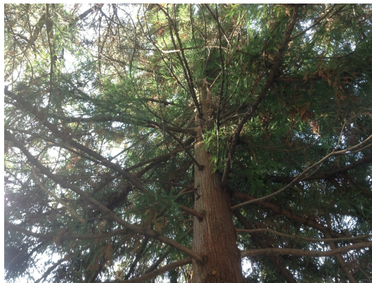
, 28 Août 2013