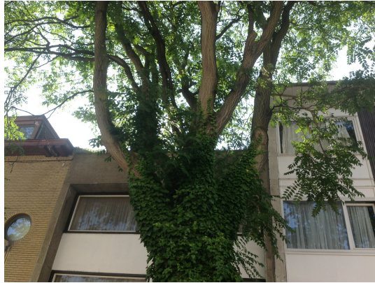
, 28 August 2013