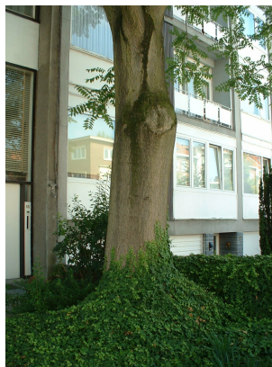
, 08 September 2003