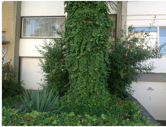
, 28 August 2013