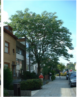
, 08 September 2003