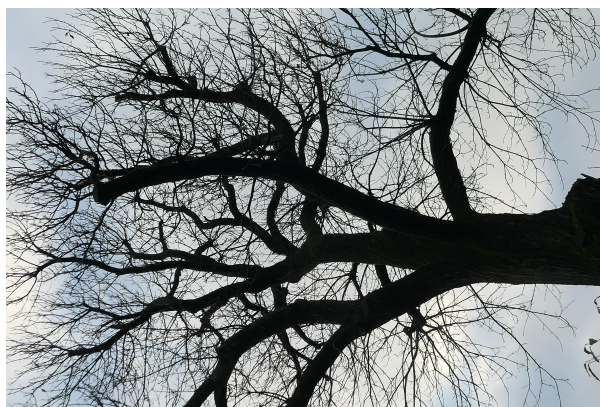
, 06 Décembre 2023