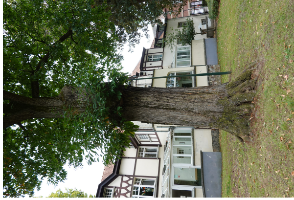
, 09 Septembre 2025