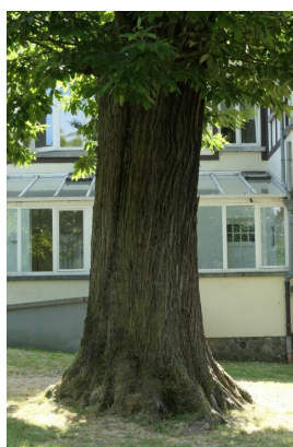
, 03 Juin 2020