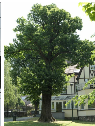
, 03 Juin 2020