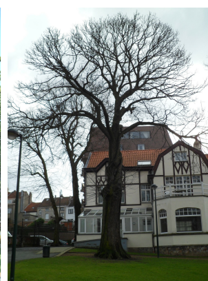
, 08 Mars 2012