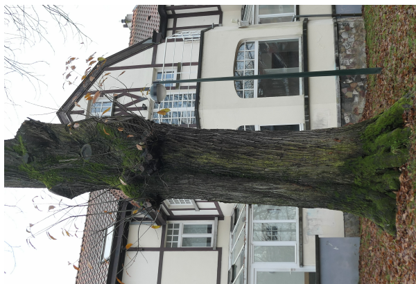
, 06 Décembre 2023