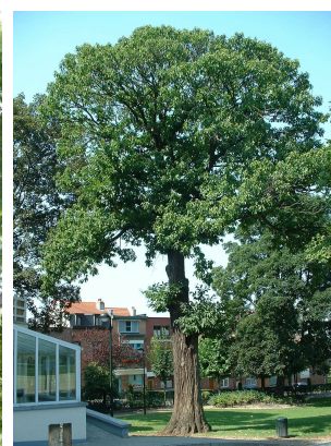
, 04 Août 2003