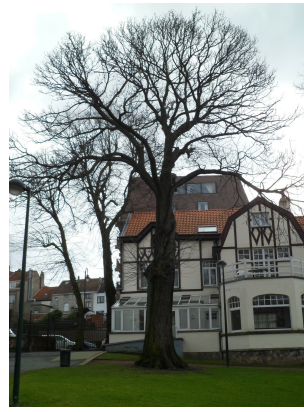
, 08 Mars 2012