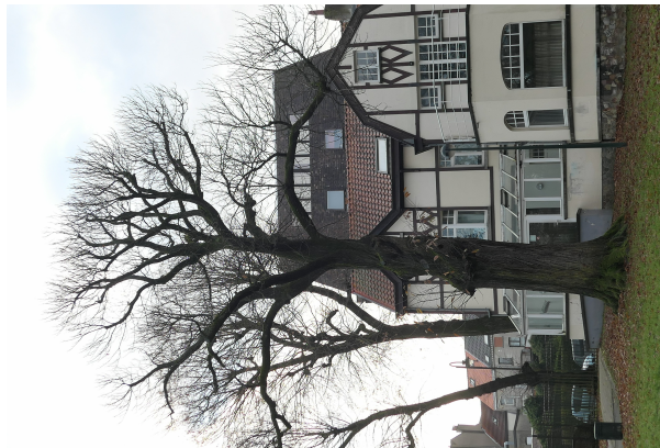
, 06 Décembre 2023