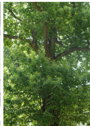
, 03 Juin 2020