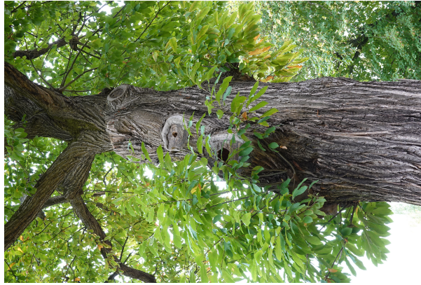
, 09 Septembre 2025