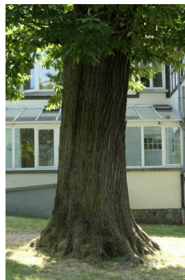
, 03 Juin 2020