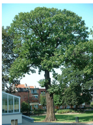
, 04 Août 2003