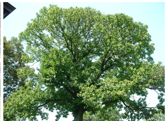
, 04 August 2003