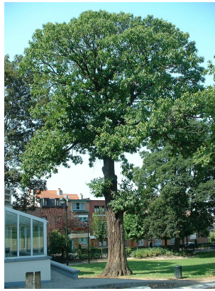
, 04 August 2003