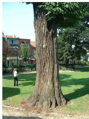
, 04 August 2003