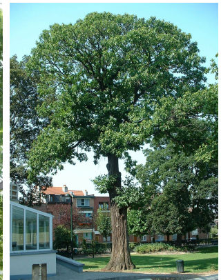
, 04 August 2003