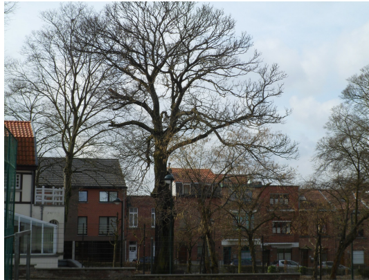
, 08 Maart 2012