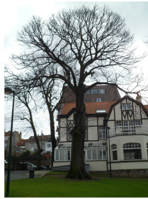
, 08 Maart 2012