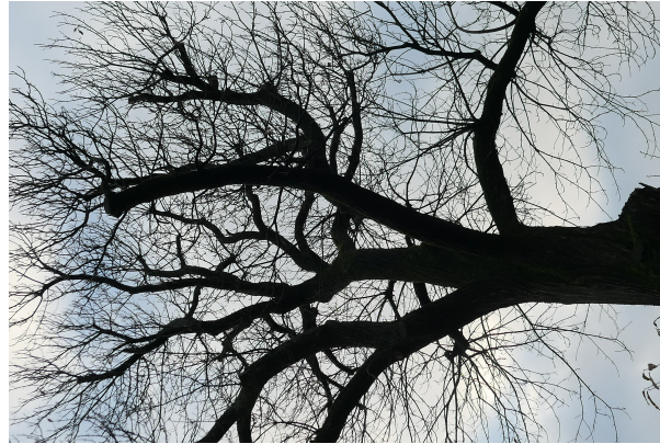
, 06 December 2023