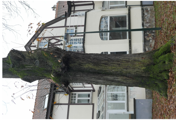
, 06 December 2023