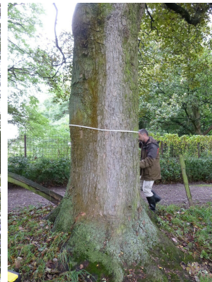
, 17 Octobre 2013