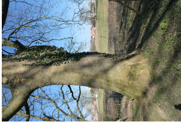
, 04 Mars 2025