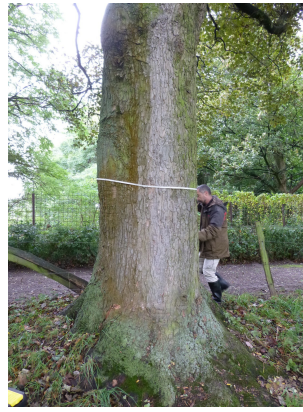
, 17 Oktober 2013