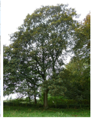
, 17 Oktober 2013