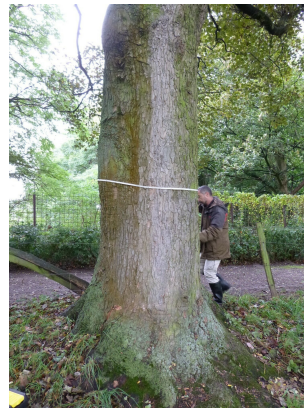
, 17 Oktober 2013