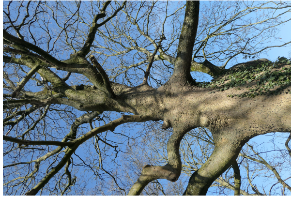
, 04 Maart 2025