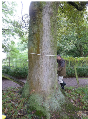
, 17 Oktober 2013