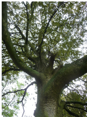
, 17 Oktober 2013