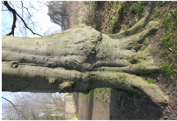
, 15 February 2023