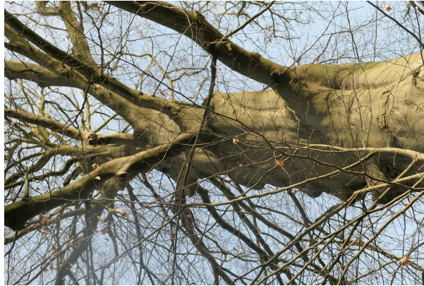
, 15 February 2023