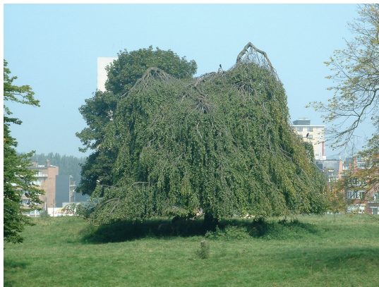
, 08 Août 2003