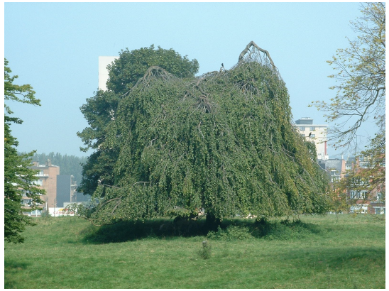
, 08 August 2003