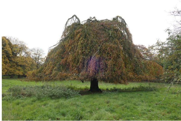
, 14 November 2019