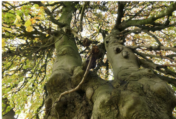
, 14 November 2019