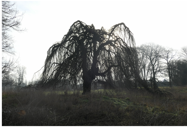
, 15 February 2023