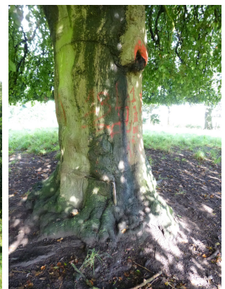
, 11 September 2013