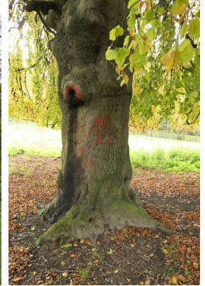
, 14 November 2019