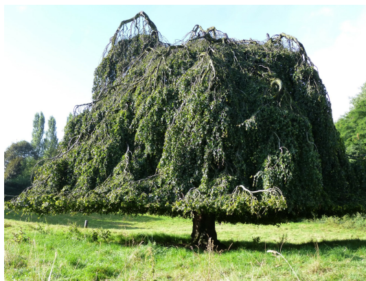
, 11 September 2013