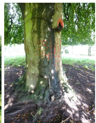
, 11 September 2013