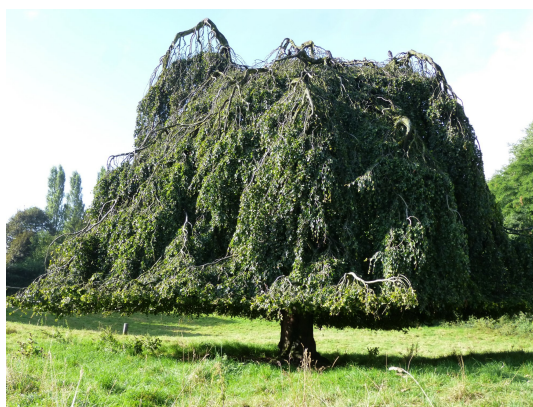
, 11 September 2013