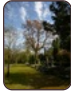
Erable plane Evere Cimetière de Bruxelles