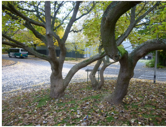
Catalpa à feuilles d'or,