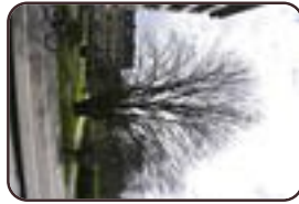
Erable sycomore Evere Avenue Henry Dunant