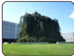
Hêtre pleureur Evere Chaussée de Louvain, 862