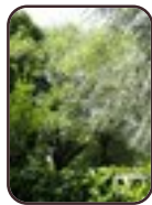
Salix sp Evere Rue de la Marne, 5