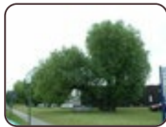
Saule cassant Evere Rue de Strasbourg