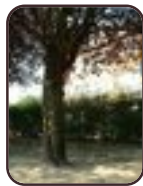
Prunus cerasifera f. spaethiana Evere Avenue Henri Conscience