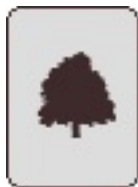
Cerisier grêle Evere Avenue des Anciens Combattants