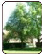
Sorbier des oiseaux (des oiseleurs) Evere Quartier Tornooiveld Avenue du Pennon