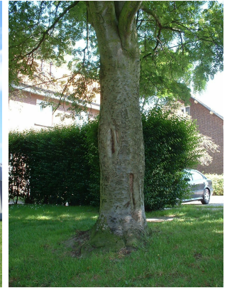
Sorbier des oiseaux (des oiseleurs), Quartier Tornadoiveld