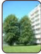
Tilleul du Caucase Evere Quartier Tornooiveld Avenue du Destrier