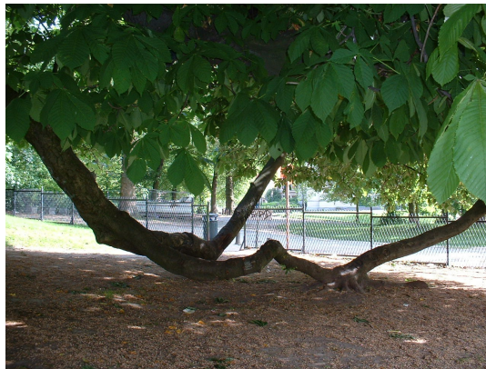
, 21 Mei 2002