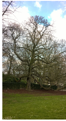
, 01 April 2016