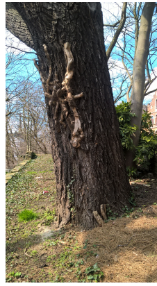
, 01 April 2016