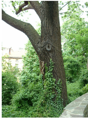
, 21 Mei 2002